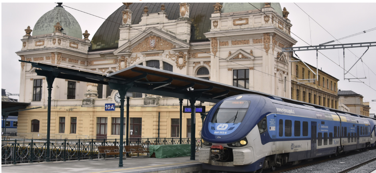
01 — Fasáda budovy se bude opravovat pod dohledem památkářů, celý objekt je totiž památkově chráněný

Předmětem stavby je komplexní rekonstrukce celé výpravní budovy včetně optimalizace vnitřních dispozic a zlepšení vzájemných vazeb vnitřních prostor. Realizací projektu se zvýší komfort pro cestující a zajistí se jejich větší bezpečnost, veřejné prostory stanice budou přístupné osobám s omezenou schopností pohybu či orientace. Rekonstrukce výpravní budovy navazuje na modernizaci nástupišť a dalších částí stanice Plzeň hlavní nádraží, která proběhla v minulých letech. Celkovou rekonstrukcí objektu bude zamezeno dalšímu chátrání památkově chráněné budovy. Nádraží bude také více sloužit nejen cestujícím, ale i občanům a návštěvníkům krajského města.