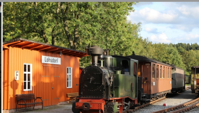
IK 54 v Lohsdorfu v srpnu 2015