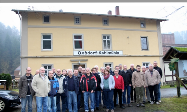
fotografie spolku před klubovnou na nádraží Kohlmühle

Regionálně jsme členem sítě Bahnerlebnis Sächsische Schweiz (Železniční zážitek Saské Švýcarsko), spojením různých spolků a podniků se zájmem o železnici.