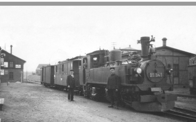
99 541 v Hohnsteinu v červnu 1933

Ihned po ukončení provozu na konci května 1951 došlo ke kompletnímu odstranění kolejiště (dokončeno v říjnu 1951). Zachovány zůstaly šterkové podloží a budovy, protože nebylo vyloučeno znovuobnovení železnice. Později byly některé části železničního náspu rozorány. Demontované koleje byly převezeny do Berlína, kde sloužily jako pomocné koleje při stavbě berlínského jižního okruhu v souvislosti se Světovými hrami mládeže v srpnu 1951.