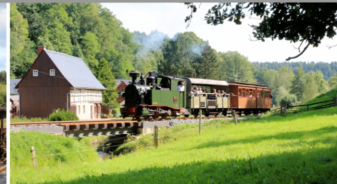
vlak IK na novém mostě v Lohsdorfu v roce 2017