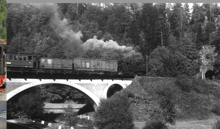
Vlak kolem roku 1926 před tunelem Schwarzberg

Tato dvanáctikilometrová úzkokolejka byla dokončena po pouhých dvou letech stavby. Za toto období bylo postaveno 12 mostů z ocelových nosníků, 12 betonových mostů, 2 tunely a 2 mosty s betonovými oblouky. K tomu nádraží Lohsdorf, Unterehrenberg a Oberehrenberg každé s objízdou kolejí. V Hohnsteinu byla vozovna se dvěma místy, v Goßdorfu-Kohlmühle vozovna s jedním místem. Navíc překladací hala s jednou kolejí s normálním rozchodem a s jednou úzkorozchodnou kolejí.