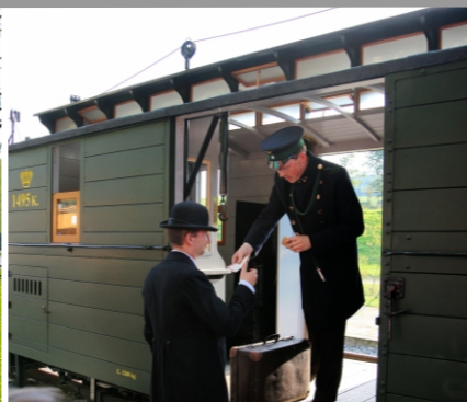
podávání zavazadel u vagonu strojvedoucího