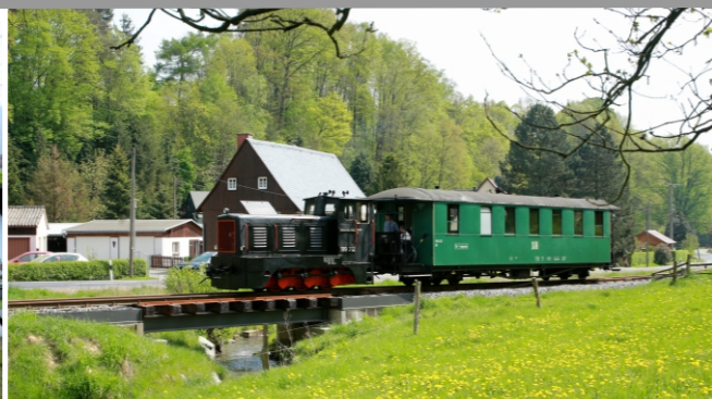
naftová lokomotiva na mostě v Lohsdorfu v roce 2018