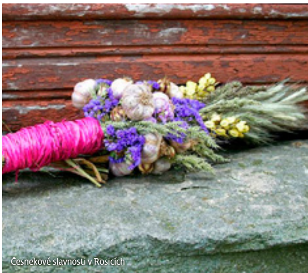
Česnekové slavnosti v Rosicích

Podrobné informace měsíc před akcí v pokladně č. 1 ve stanici Brno hl. n., na tel. 725 886 395 nebo e-mailu bnohn@cdcentrum.cd.cz