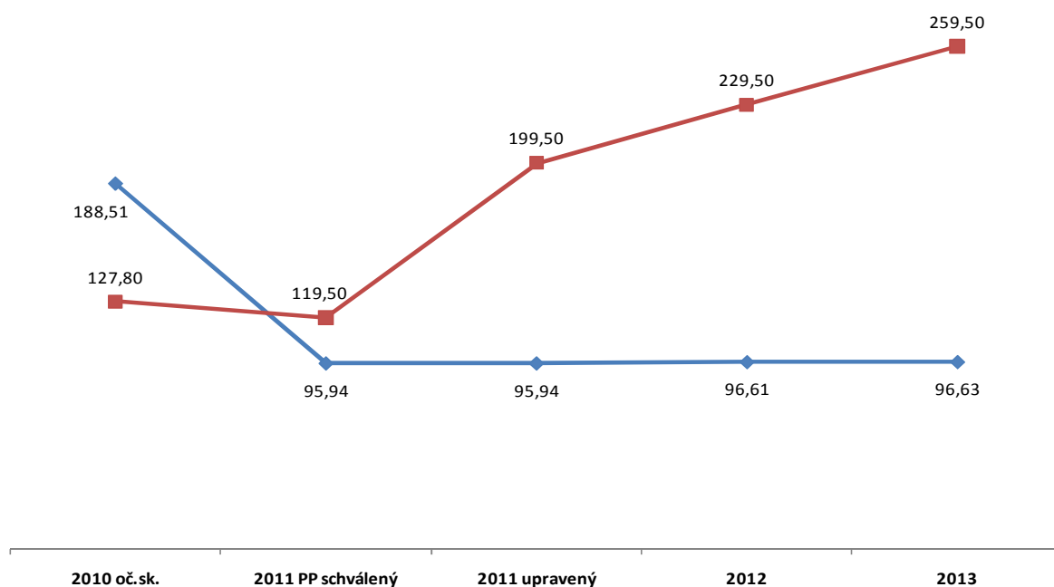
Graf Vývoj výnosov z poplatku za ŽI a úhrady fixnej časti EON