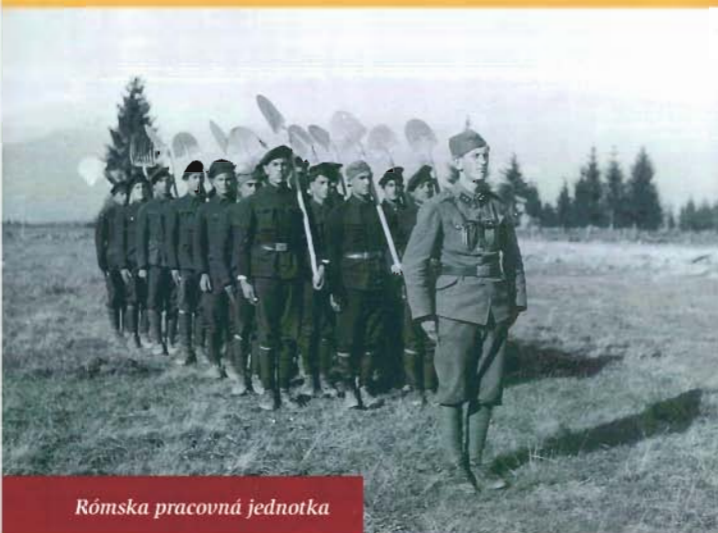
Rómska pracovná jednotka

a neprispôsobivé, čo sa prejavovalo v zákonodarstve už od marca 1939 a vyústilo do otvorenia koncentračného tábora v Ilave v apríli 1939. Pracovné tábory začali vznikať v roku 1941 nariadením s mocou zákona O pracovnej povinnosti. Do začiatku Slovenského národného povstania prešlo týmito tábormi okolo 6 000 väzňov. Následne z rozhodnutia vlády vznikli vojenské pracovné útvary. Na základe vyhlášky ministerstva vnútra z apríla 1941 a neskôr v zmysle Židovského kódexu začali vznikať pracovné tábory pre Židov. Pracovali v nich židovskí muži vo veku od 16 do 60 rokov a v druhej polovici roku 1941 bolo okolo 5 500 väzňov internovaných v 80 pracovných strediskách. Strážnu službu v nich konali príslušníci Hlinkovej gardy a Freiwillige Schutzstaffel.