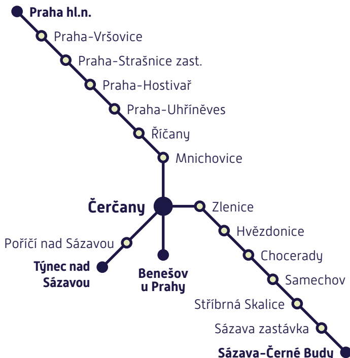
Schéma historických vlaků